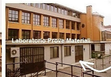
Laboratorio Prove Materiali

Ingresso da via Morbelli 33 del cortile dell'I.I.S. Nervi Fermi Al e del Laboratorio Prove Materiali